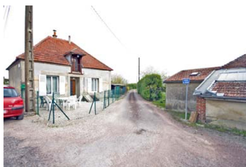
Chemin des Noyers : ouverture de l'espace urbain sur l'espace agricole