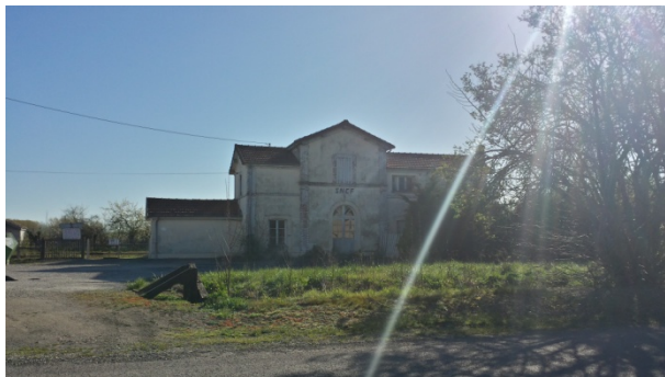
L'ancienne gare SNCF