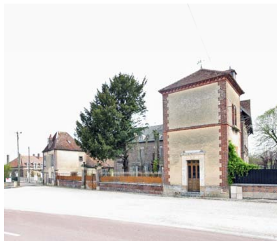
Logement vacant rue de Chily