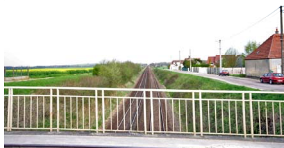
Rue de la Couronne et ligne de chemin de fer