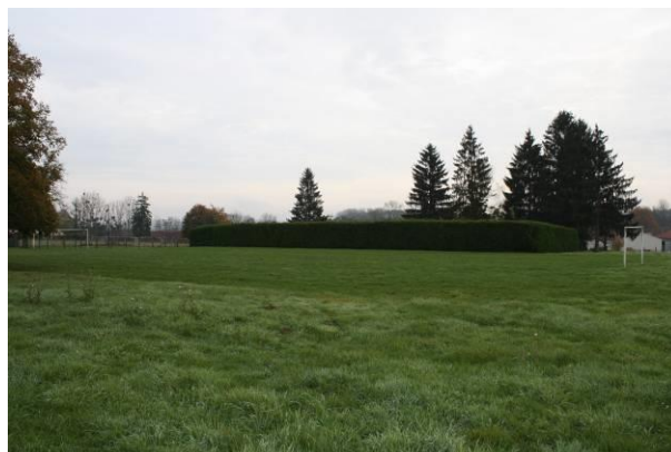
L'espace d'équipements derrière l'école à développer

La commune souhaite maintenir son niveau d'équipements, voire le développer en fonction de son essor démographique. Ainsi elle souhaite affirmer le pôle d'équipement mairie-école-espace sportif, et proposer un stationnement adapté près du Manoir. Pour cela, la commune a besoin de réserves foncières pour pouvoir réaliser ces projets.