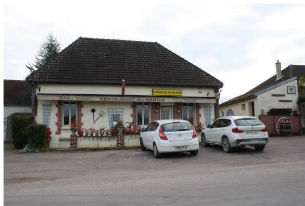
Services et commerces de proximité

Le maintien du tissu économique (commercial, artisanal, ...) est important afin que la commune puisse proposer une mixité des fonctions sur son territoire. L'accueil de nouvelles activités compatibles avec l'urbanisation est souhaité.