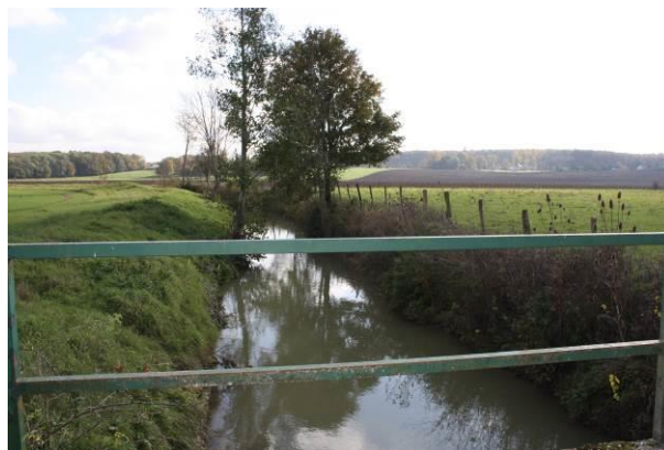
L'Hozain dans la plaine agricole

La commune souhaite protéger les espaces naturels référencés sur son territoire telles que les ZNIEFF (Zones Naturelles d'Intérêt Écologique Faunistique et Floristique) et la réserve biologique intégrale et veiller à limiter l'impact sur les autres ZNIEFF alentours.