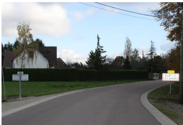
Continuité entre Nicey et le bourg

La commune souhaite poursuivre les continuités urbaines déjà commencées entre les hameaux/faubourgs de Nicey et du Bouchot et le bourg, en privilégiant une urbanisation le long des voies de desserte et un épaissement léger du bourg. Le hameau du Long du Bois conserve son statut de hameau isolé.