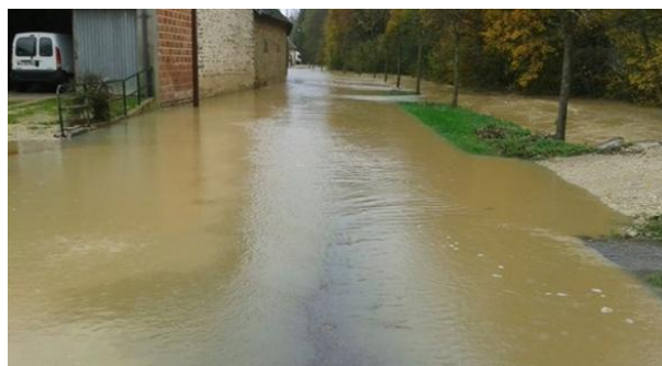
Inondation de 2013 – débordement de l'Hozain

Elle souhaite vivement que cette problématique soit prise en compte dans le PLU, en limitant fortement les constructions dans les zones fréquemment inondées identifiées.