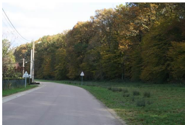
Le paysage des lisières

De plus, il est important, pour chaque parcelle bâtie, de maintenir des espaces libres (jardin, cour...) pour conserver le caractère rural du village.