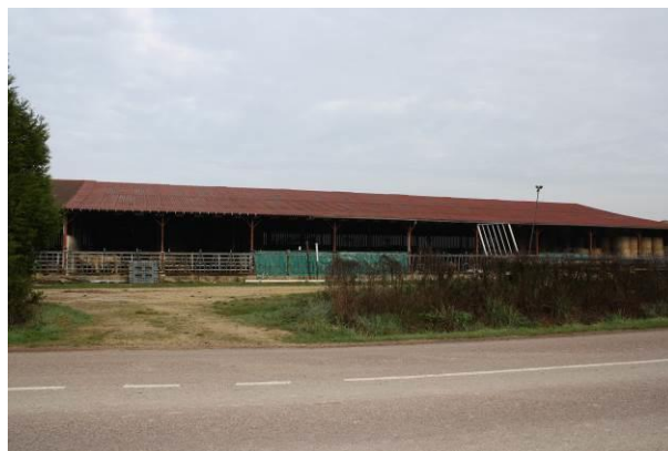
Bâtiments agricoles en entrée du bourg

L'activité d'élevage est prise en compte en respectant les périmètres de protection sanitaire réciproque entre les bâtiments d'élevage et les tiers.