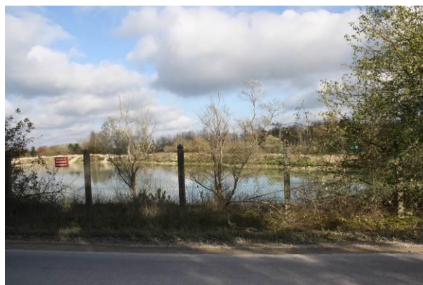
Les trous d'eau résultant des carrières

La réhabilitation des anciennes carrières en trous d'eau et les nouvelles activités que cela génèrent (pêches, espaces de détente) ont fait l'objet de plusieurs installations légères de loisirs. Il semble que ces installations soient désormais suffisantes et la commune ne souhaite plus admettre des installations de ce type afin de limiter les constructions dans ces espaces éloignés des zones urbanisées.