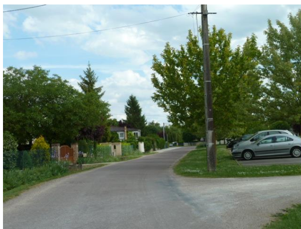
Des voiries plus ou moins larges selon les usages

Le réseau de chemins communaux sera préservé et pourra être développé, que ce soit pour relier les différentes entités bâties, pour le déplacement des engins agricoles ou pour la promenade.