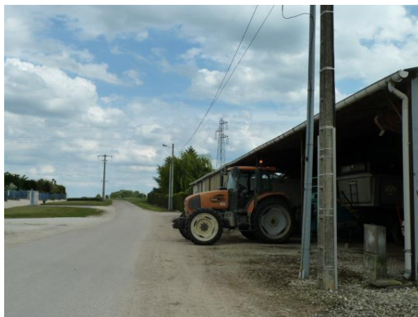
Exploitation agricole dans le tissu urbain

L'activité d'élevage et le centre équestre sont pris en compte en respectant les périmètres de protections sanitaires réciproques entre les bâtiments accueillant des animaux et les tierces personnes.