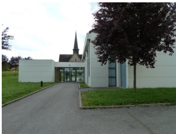
Pôle d'équipements dans le centre bourg

Elle souhaite le maintien d'équipements de loisirs sur le parc de Menois. Toutefois, les activités de loisirs devront être compatibles avec les espaces habités alentours. Ainsi les nuisances sonores, entre autres, doivent être impérativement limitées.