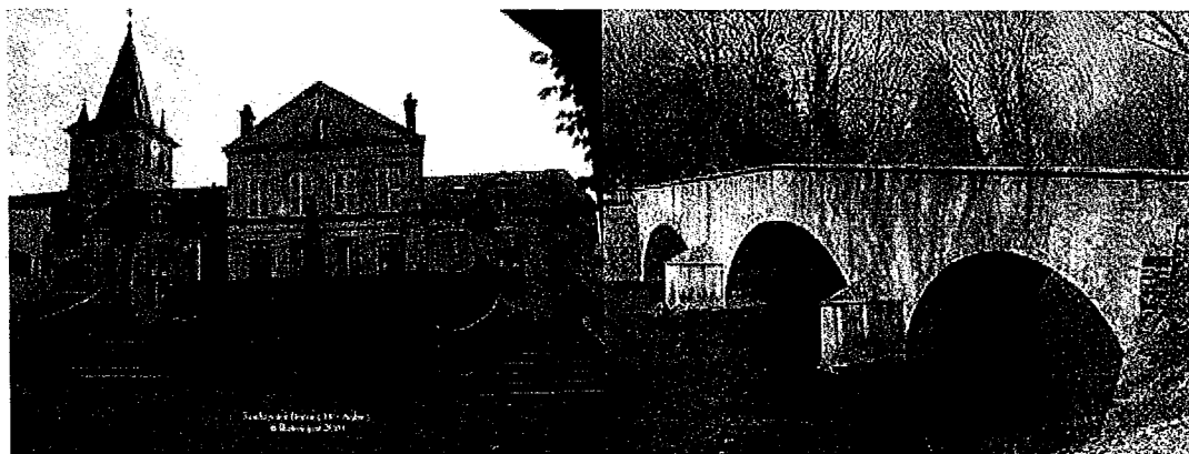
La Mairie - l'Eglise-

La rivière a un débit assez faible mais régulier, de 2 m 3 /s en été à 18,4 m 3 en hiver.