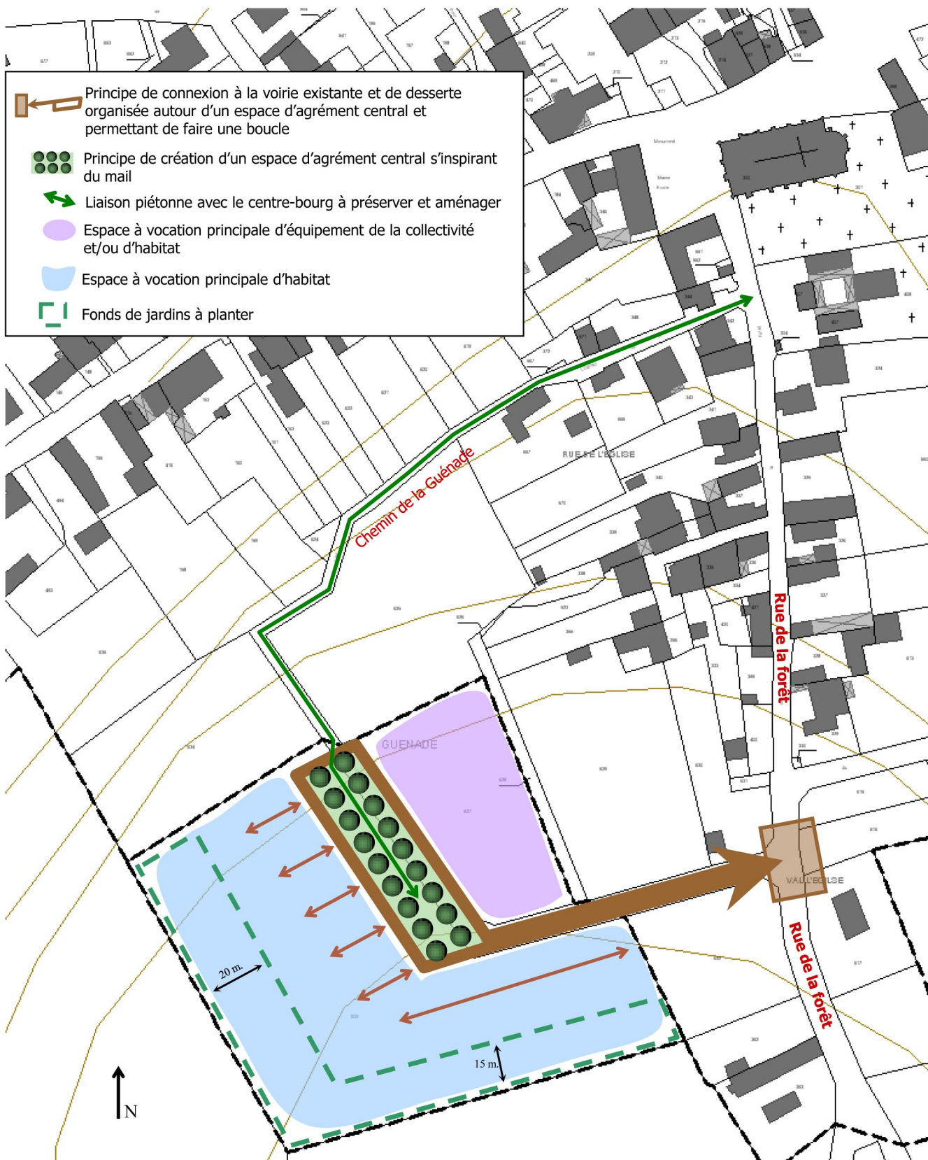
Schéma de principes pour l'aménagement de la zone AU