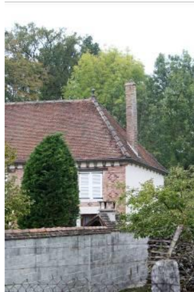
Cheminée ronde dans le bourg

La valorisation de ce bâti peut émerger de l'initiative privée, mais aussi de la volonté de la commune avec la mise en place d'un sentier de valorisation du patrimoine.