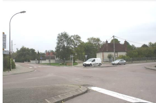
Croisement de routes départementales

Le maintien et le développement des circulations douces et un développement urbain raisonné favorisent une réduction des émissions de gaz à effet de serre.