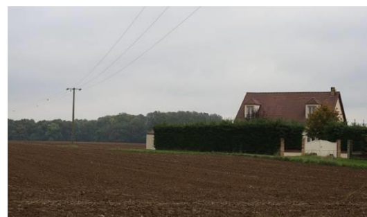
Frange végétale entre une habitation et une parcelle cultivée

Le paysage local passe également par une gestion adaptée des aménagements des espaces publics, et notamment par le traitement des transitions et lisières avec l'espace privé.