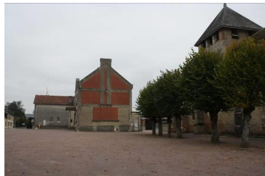
Aire de stationnement devant l'église

La commune souhaite réaménager la place de l'église, afin qu'elle puisse également accueillir des manifestations comme la fête foraine.