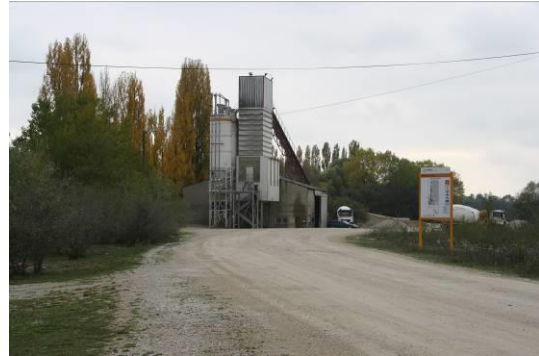
Installation au sein des carrières

Les carrières présentes sur le territoire constituent des ressources naturelles bénéfiques au développement de la commune.