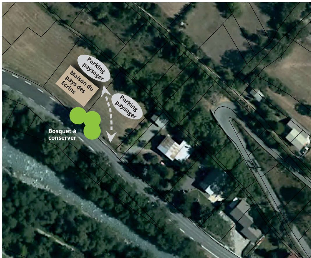
Schéma de l'aménagement du site

Le bosquet le long de la RD sera conservé.