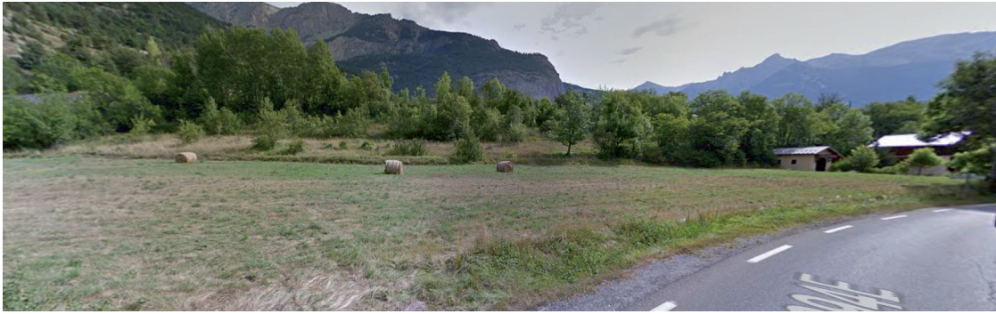
Vue sur le site depuis la RD 994 E en direction de l'Argentière