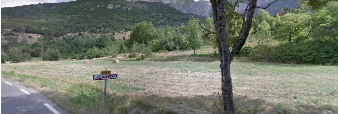
Vue sur le site depuis la RD 994 E en direction de Vallouise