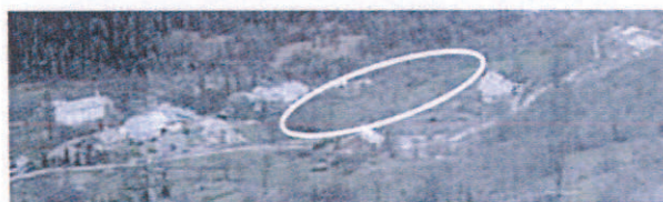
Vue de la zone AU depuis l'amont