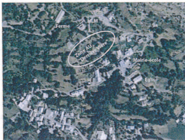
Plan de situation de la zone AU

• Mode de déblocage: par tranche, au fur et à mesure de la réalisation des équipements publics internes à la zone.