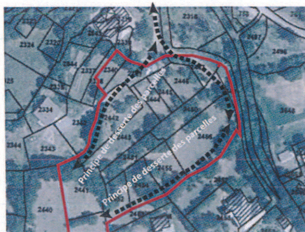
Principe de desserte des parcelles