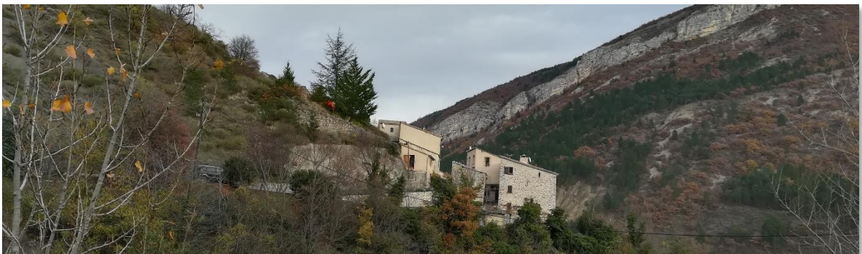
Silhouette du village de Saint-Genis