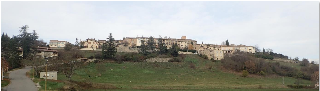
Silhouette du village de Lagrand