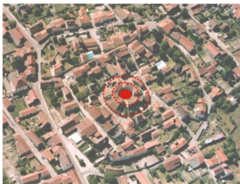
L'aire circulaire centrale (la Cour des Dames)