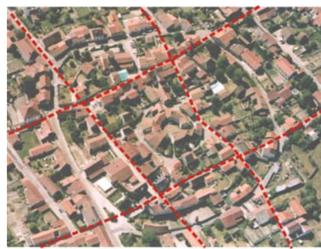
Système de voirie orthogonale se superposant à la forme urbaine concentrique