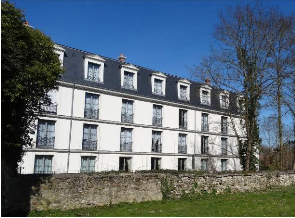
l'Établissement d'hébergement de personnes âgées dépendantes - EHPAD

👉 En matière d'équipements publics (équipements culturels, sportifs, de santé et de protection sociale, etc.) et de services à la population, la commune de NOGENT-L'ARTAUD dispose d'un bon niveau général.