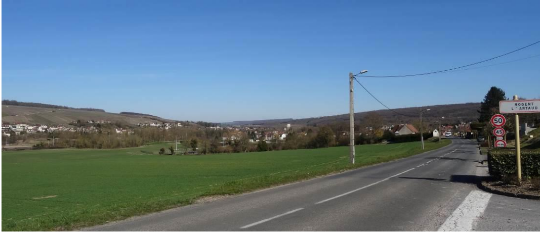
Entrée de Nogent l'Artaud depuis Pavant