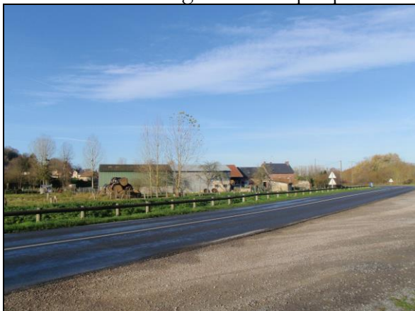
Ferme – Rue Saint-Georges