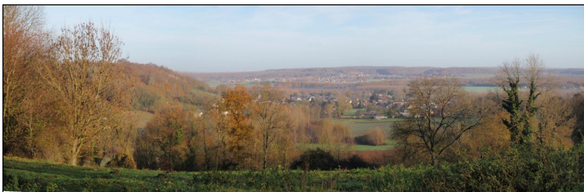
Vue sur GUNY du « Mont de GUNY »

GUNY dispose d'un patrimoine naturel de qualité, propice au développement touristique. L'existence de nombreux sentiers de promenade et de randonnée offrent un atout important à ce niveau.