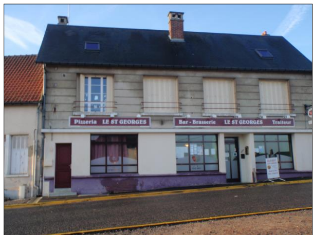
Restaurant le Saint-Georges

L'implantation d'établissements commerciaux sera rendue possible dans toutes les zones urbaines tant que cette activité ne sera pas incompatible avec les autres objectifs du PADD et avec le confort d'usage des zones d'habitat.