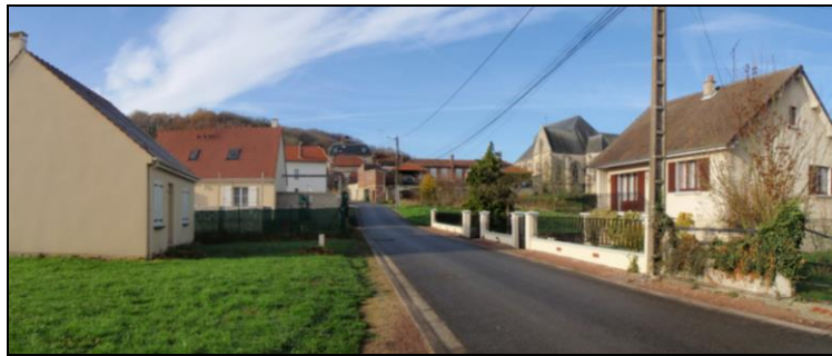
Rue des Lilas