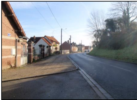
Rue du 9 ème Zouave

La délimitation des zones constructibles à vocation principale d'habitat tient compte à la fois du nombre d'habitants supplémentaires susceptibles d'être accueillis, du besoin de logements lié au desserrement de la population et d'une estimation du taux de non réalisation de ces potentialités foncières.