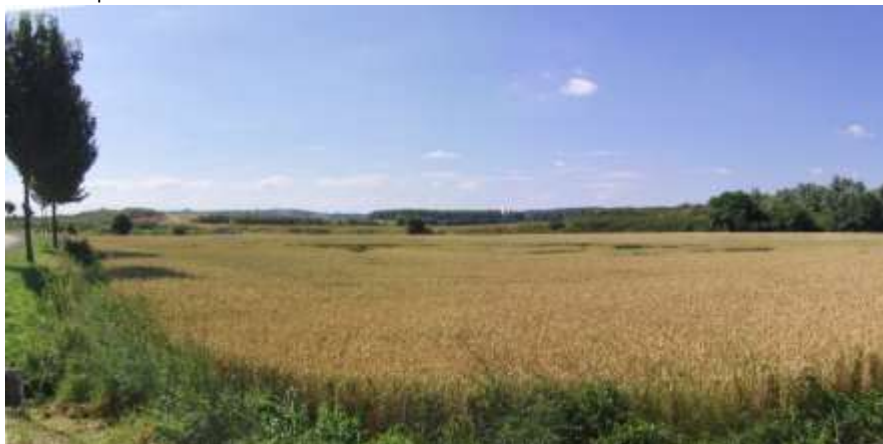
Les terres cultivées de la plaine