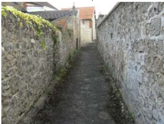
Sente rue de Broyon