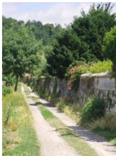
Sente de la Terrière

⇒ Prévoir la création de nouveaux équipements :