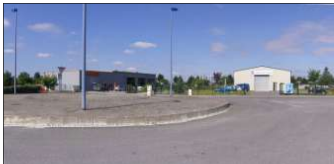
Zone activités de la Fosselle