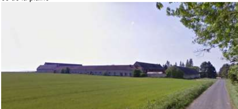
Les terres cultivées du plateau et l'ancienne ferme de la Montagne