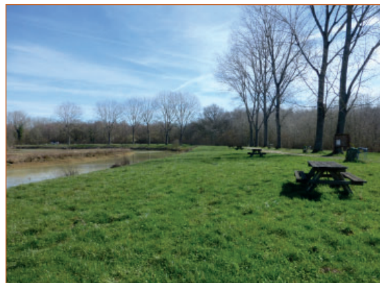
Étang de pêche de la Combe