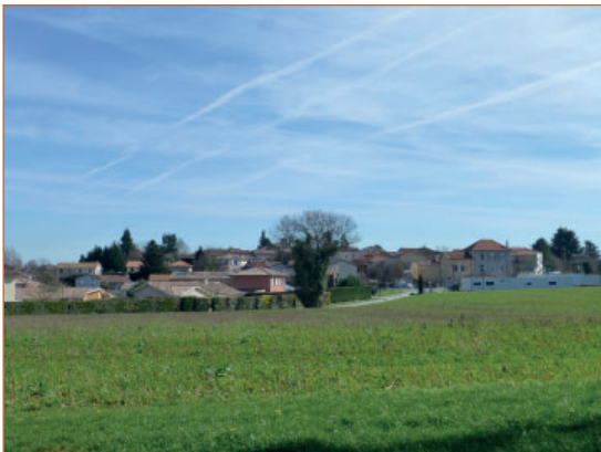
Point de vue sur le bourg