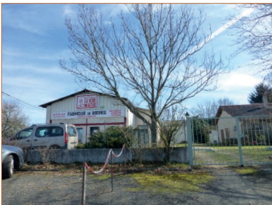
Activités économiques au hameau des Douze