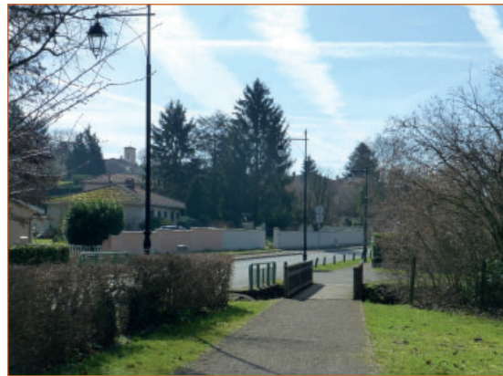
Voie modes doux