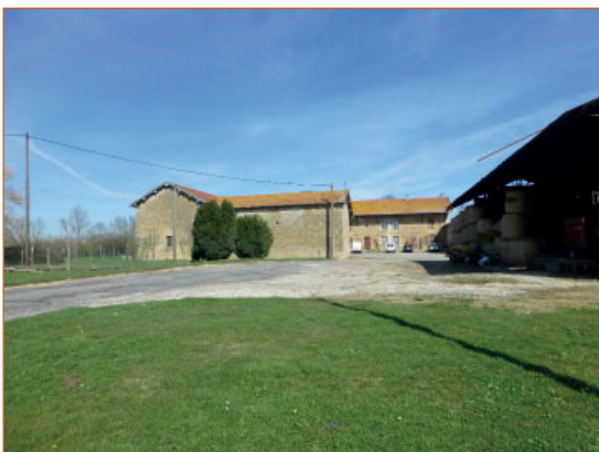
Bâti agricole d'intérêt patrimonial