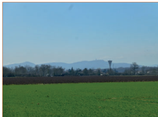
Point de vue sur le paysage lointain