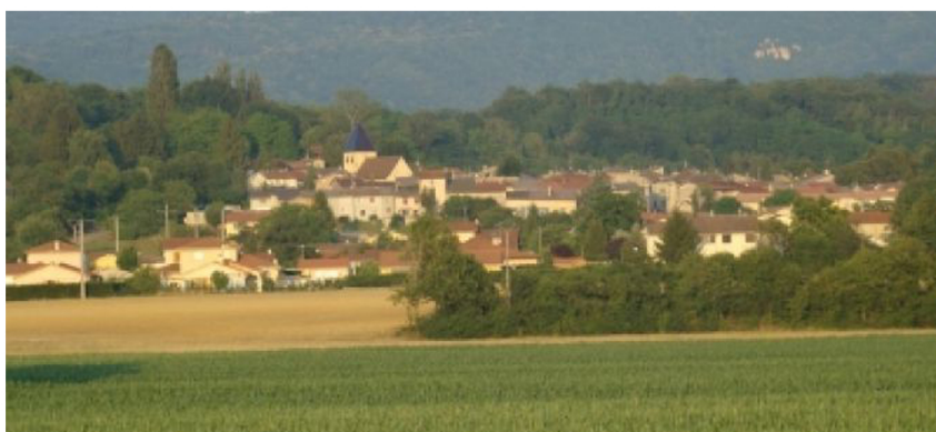
Vue depuis les champs