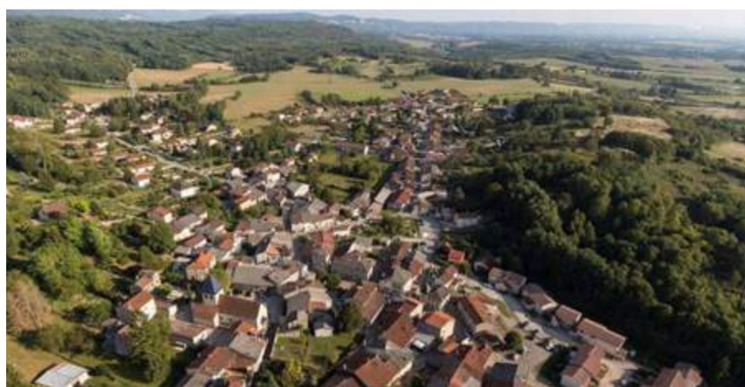
Vue depuis le ciel