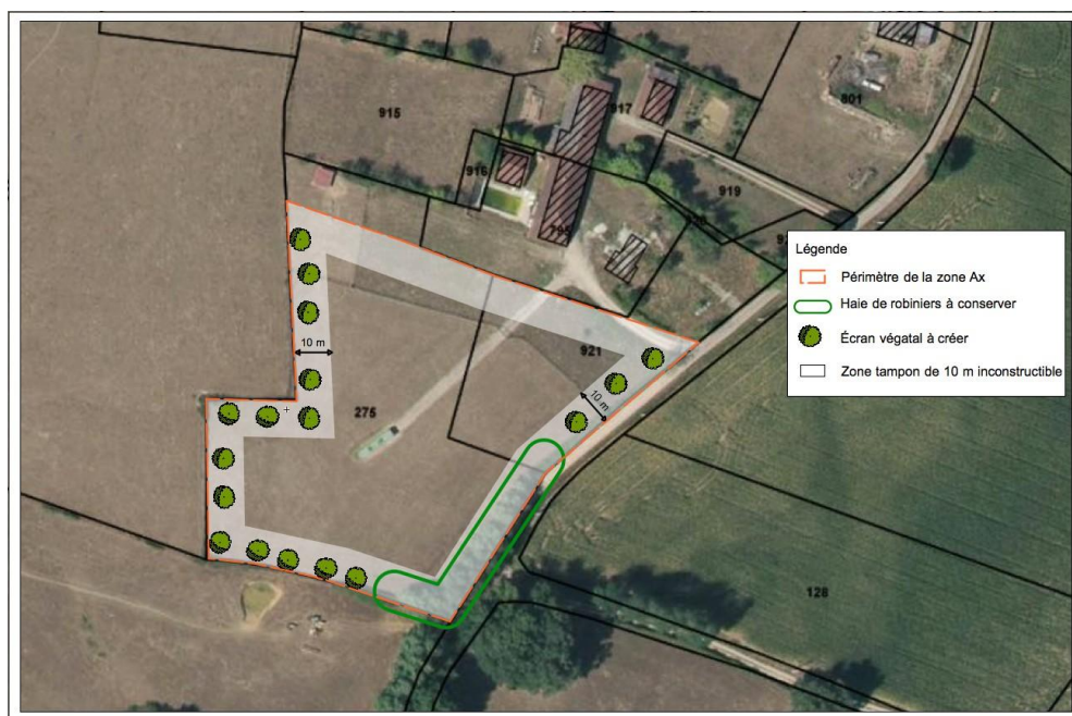
ILLUSTRATION DES PRINCIPES APPLICABLES À LA ZONE Ax

Informations complémentaires concernant les éléments nécessaires à mettre en œuvre pour le projet :