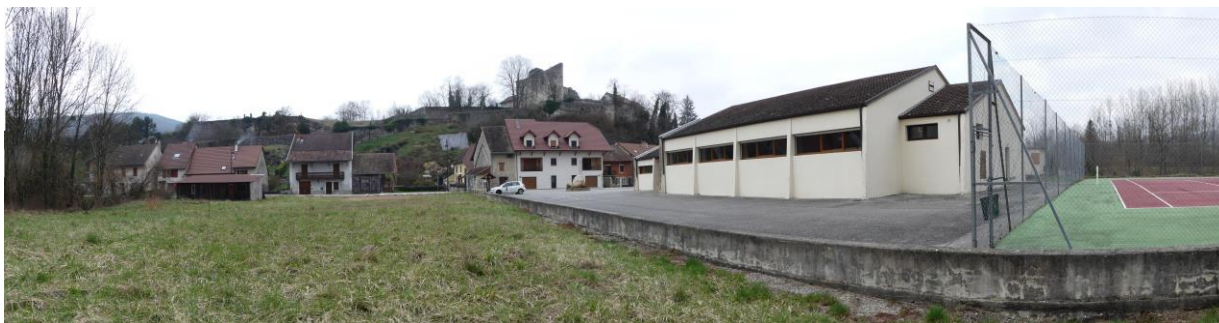
Parvis de la salle des fêtes

Sur le hameau de Parissieu, la place du centre, au croisement des rues du centre et de la route des Granges reste très fonctionnelle. Le projet de PADD prévoit une valorisation de ce cœur de bourg avec un traitement au sol et la valorisation de son patrimoine annexe (lavoir).