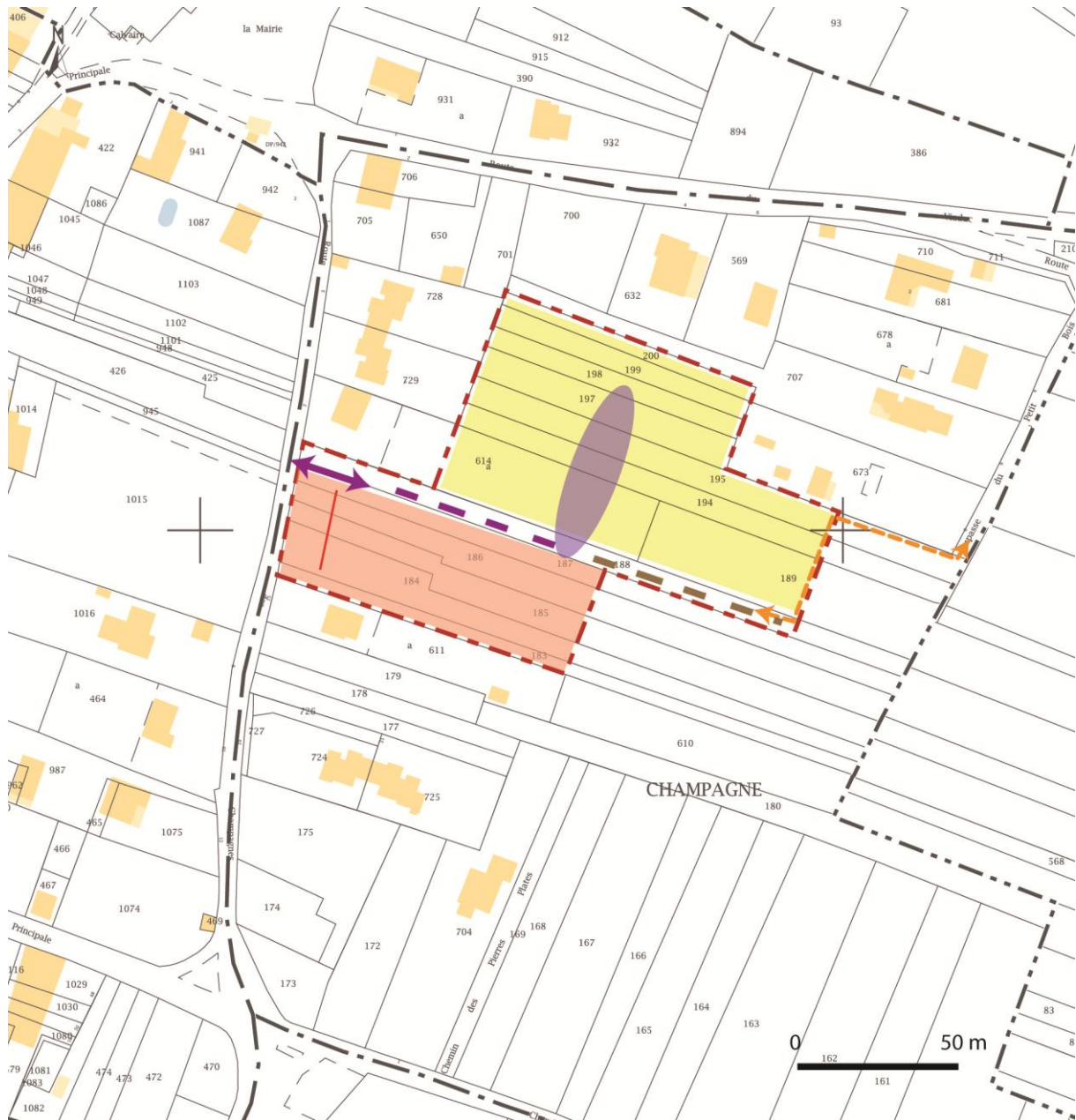
Schéma de synthèse