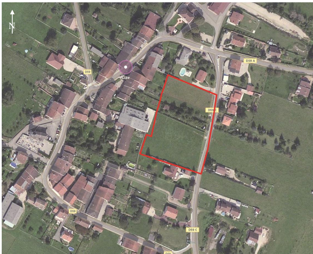
Localisation du site – fond Bing carte – sans échelle