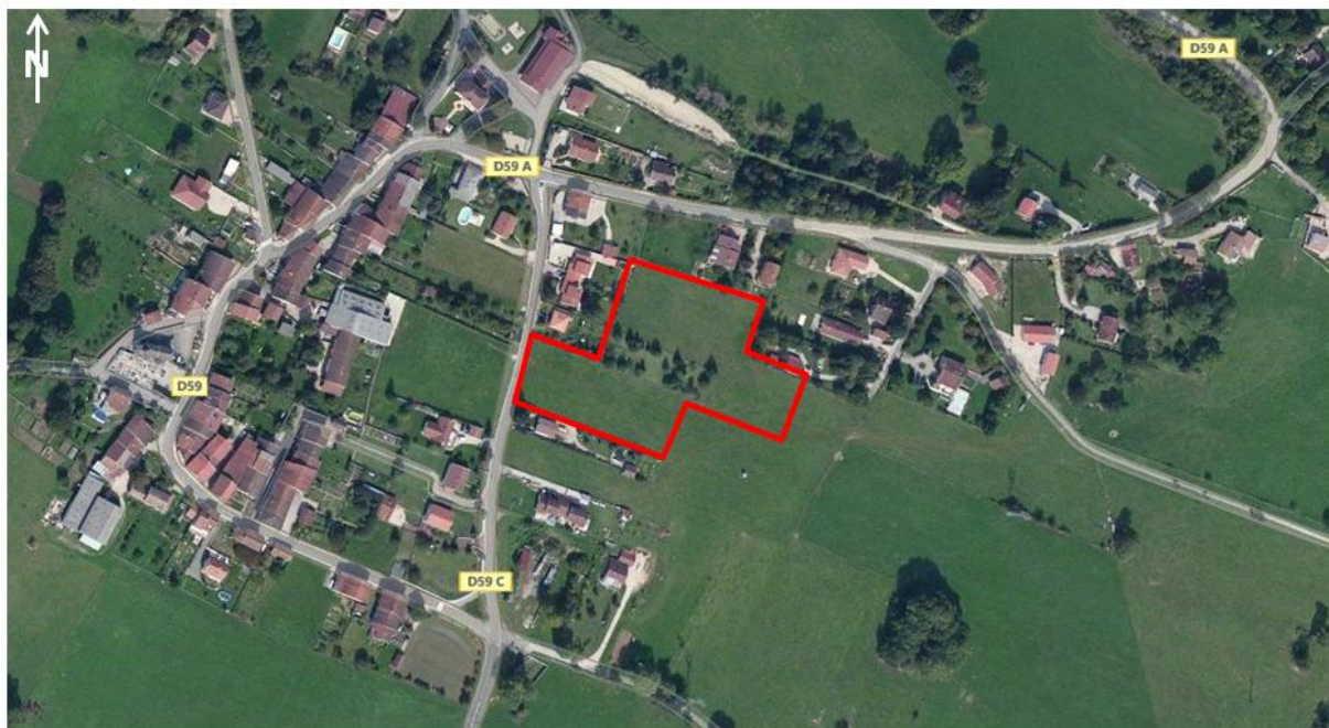
Localisation du site – fond Bing carte – sans échelle