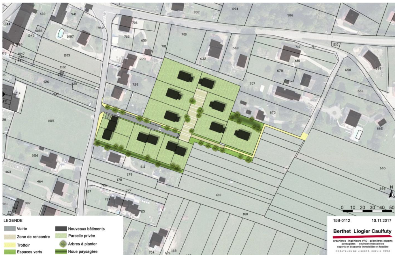
Exemple d'aménagement de la zone 1AU – Berthet Liogier Caulfuty (02/2016-mises à jour 09/2016 et 11/2017)